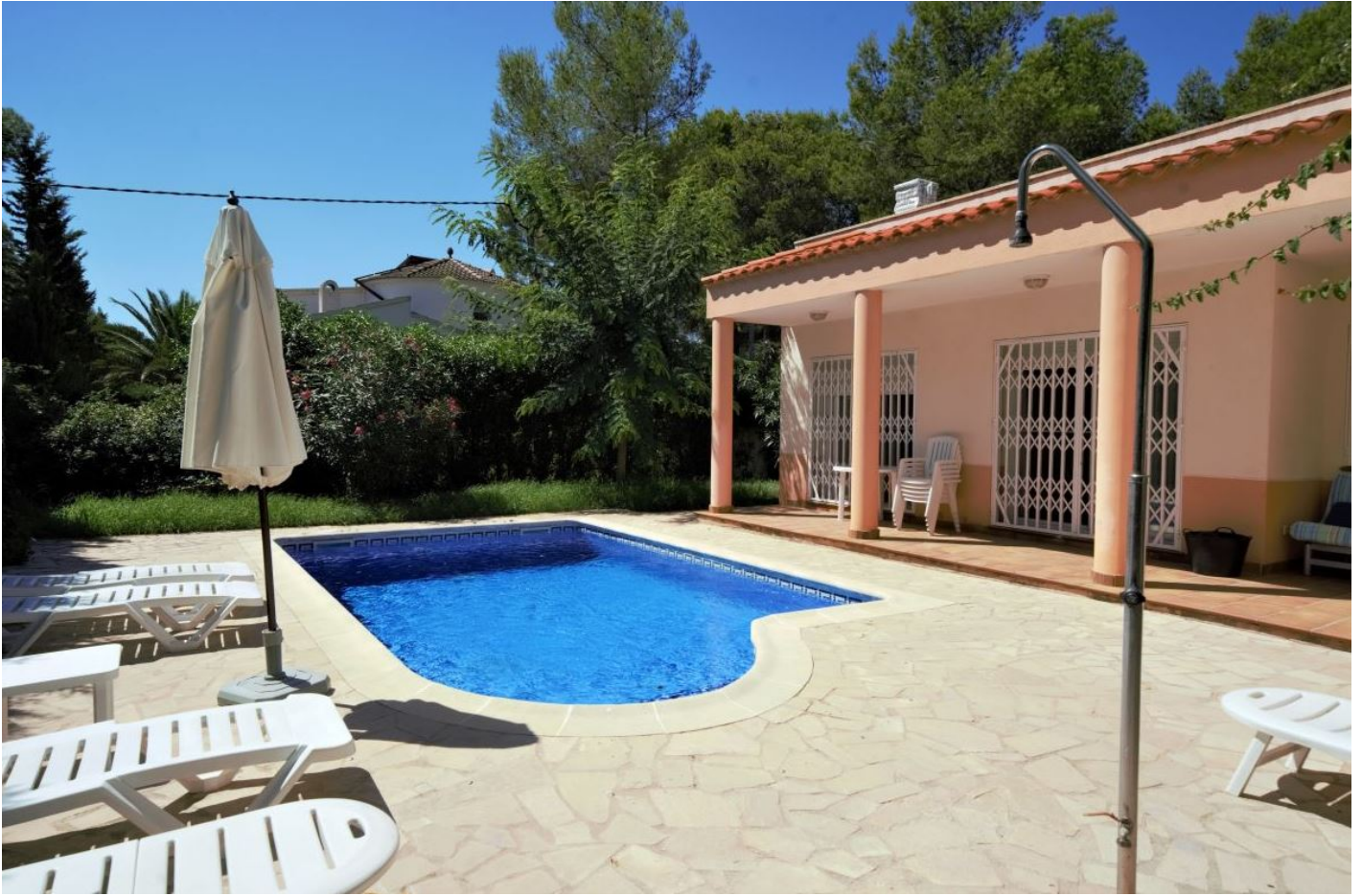
VILLA DOS - 6 PERSONNES - L'AMETLLA DE MAR - TARRAGONE - ESPAGNE